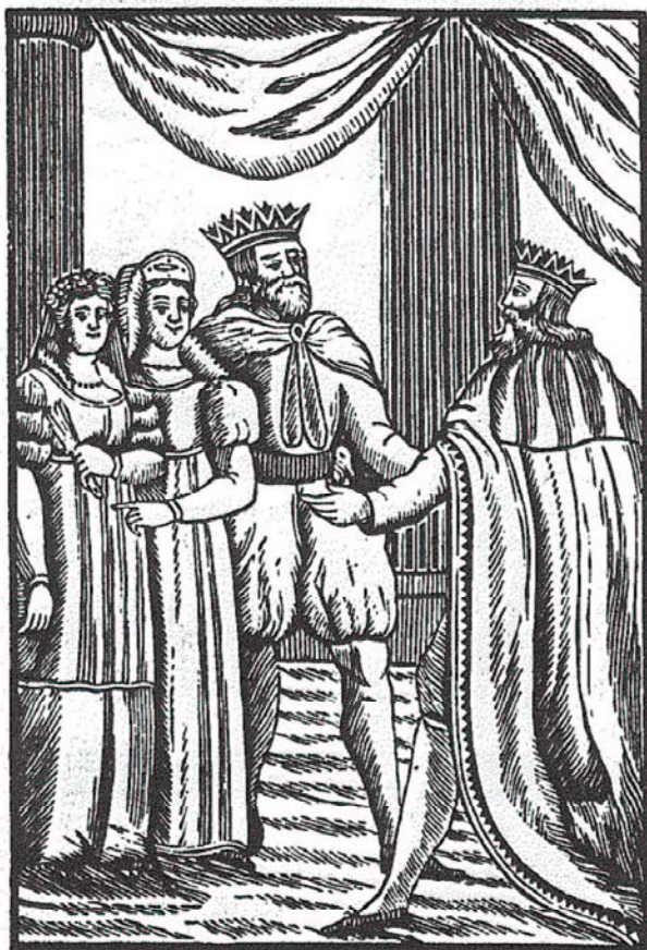
Le Roi et la Reine d'Espagne recommandant leur fille au Roi de France.