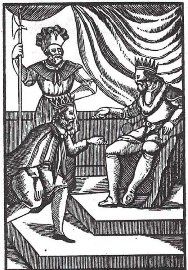
Le Roi d'Espagne à genoux, demandant secours au Roi de France.

Goian iturriaren zenbait liburu azal. Behean, Nisardek erabilitako ale baten bi ilustrazio.